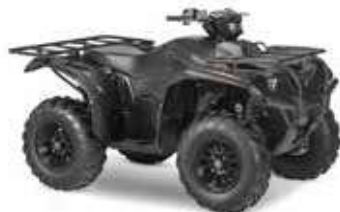
Série limitée Black Max