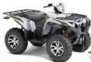
Série limitée Alu Max