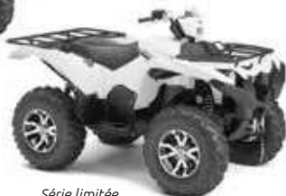
Série limitée White Max