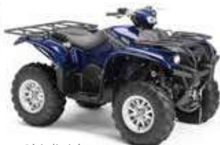
Série limitée Blue Max